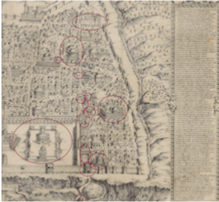
Estaciones en la Vía Dolorosa. Mapa de Jerusalén. Fray Antonino de Angelis (1578)