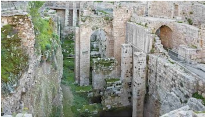
Estanque (Piscina) de Betsda