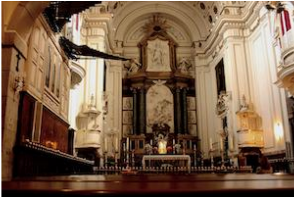
Iglesia del monasterio de las Descalzas Reales