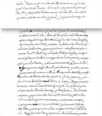
Historia y origen de la Música y Canto llano . Juan Sánchez Vidal, fols. 17r