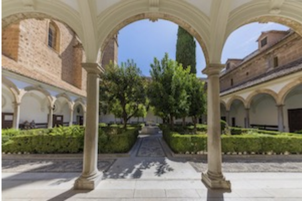
Claustriillo. Monasterio de la Cartuja de Granada