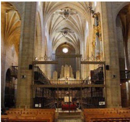
Interior de la catedral de Calahorra.