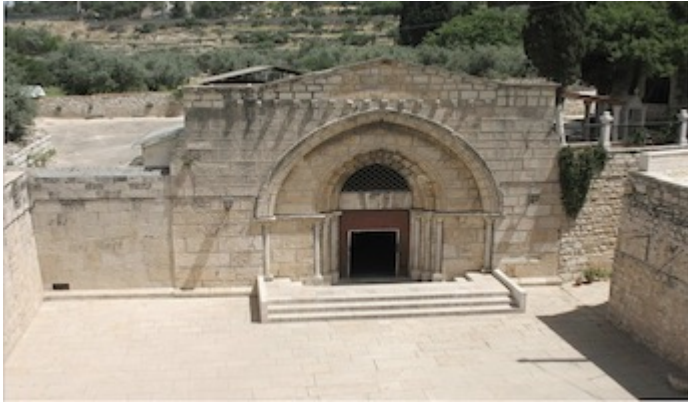
Iglesia del Sepulcro de la Virgen María (greco-ortodoxa / armenia)