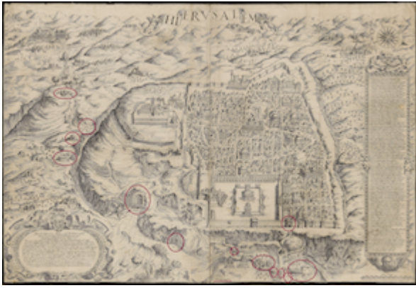
Estaciones del Valle de Josafat. Mapa de Jerusalén. Fray Antonino de Angelis (1578)