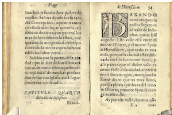
El viaje de Jesusalén. Francisco Guerrero (Sevilla, 1592), fols. 33v-40r

"http://www.youtube.com/embed/p_l8pVL5vO4?iv_load_policy=3&fs=1&origin=http://www.historicalsoundscapes.com"