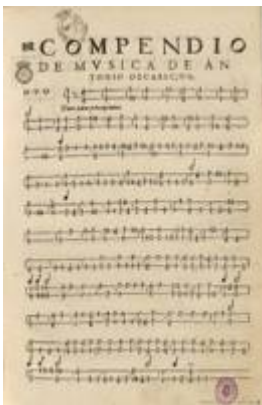
"Tres dúos para principiantes". Obras de música para tecla, arpa y vihuela (1578), fol. 1r. Antonio de Cabezón