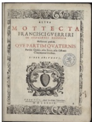
Mottecta... Liber secundus (Venecia: Giacomo Vincenzi, 1589) [G 4875]. Francisco Guerrero