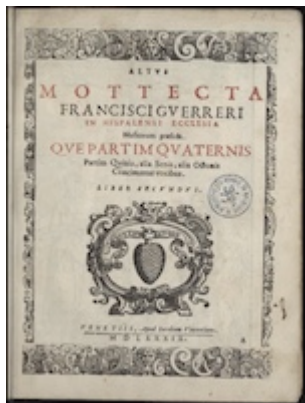
Mottecta... Liber secundus (Venecia: Giacomo Vincenzi, 1589) [G 4875]. Francisco Guerrero