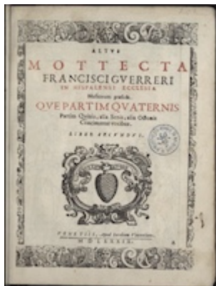
Mottecta... Liber secundus (Venecia: Giacomo Vincenzi, 1589) [G 4875]. Francisco Guerrero