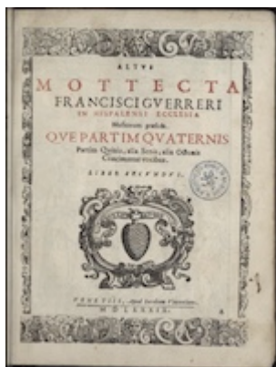
Mottecta... Liber secundus (Venecia: Giacomo Vincenzi, 1589) [G 4875]. Francisco Guerrero