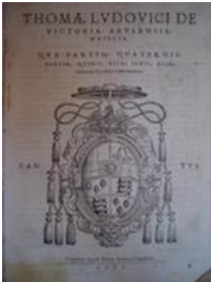
Tomás Luis de Victoria. Motecta . 1572. Monasterio de Santa Ana de Ávila