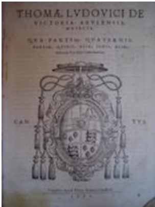
Tomás Luis de Victoria. Motecta . 1572. Monasterio de Santa Ana de Ávila