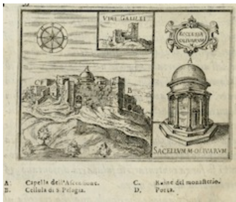
Viri Galilei. Il devotissimo viaggio di Gerusalemme . Jean Zuallart (1587), p. 174