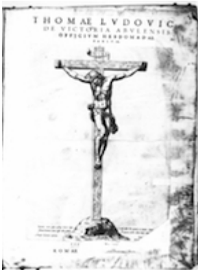
Tomás Luis de Victoria. Officium Hebomadae Sancta . Roma 1585