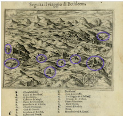
Viaggio di Bethleem. Il devotissimo viaggio di Gerusalemme . Jean Zuallart (1587), p. 223