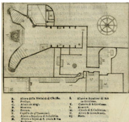
Cuevas debajo de la basílica de la Natividad. Il devotissimo viaggio di Gerusalemme . Jean Zuallart (1587), p. 241