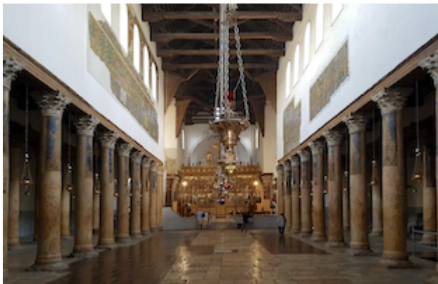
Basílica de la Natividad