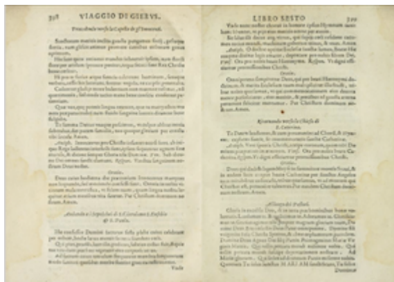
Il devotissimo viaggio di Gerusalemme . Jean Zuallart (1587), pp. 398-399