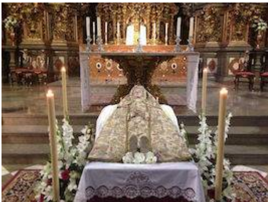
Iglesia de San Ildefonso (15 de agosto)