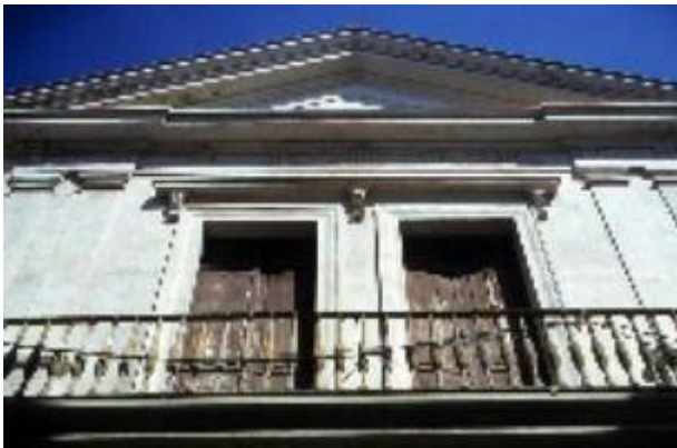
Convento de Nuestra Señora del Carmen, Casa Grande