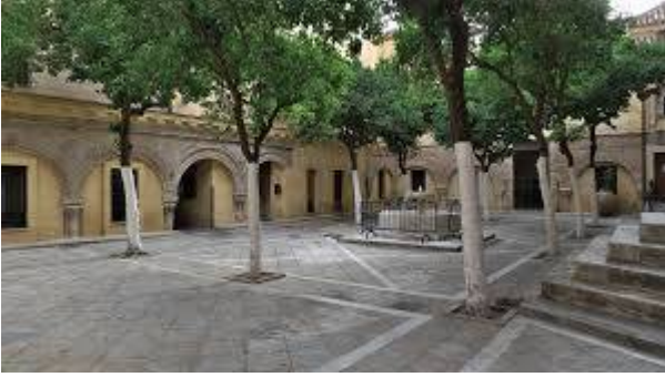
Mezquita almohade de Ibn Adabbas. Vídeo de Elisa Simon