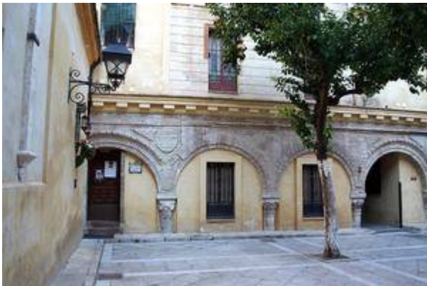
Patio de los Naranjos. Iglesia del Salvador