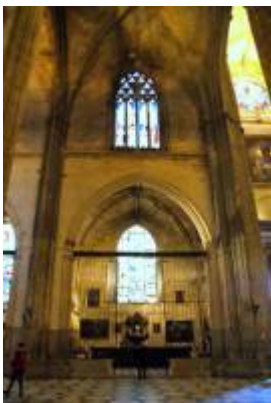
Capilla de San Francisco. Catedral