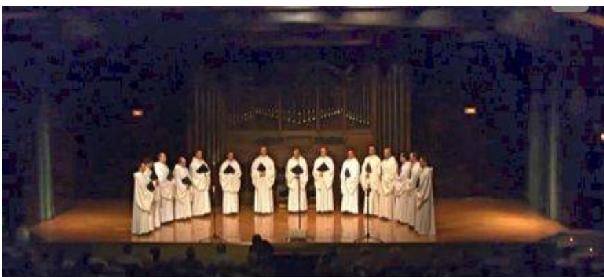
Salmo 94 y responsorio Libera me . Schola Antiqua. Músicas para bien morir. Réquiem . Fundación Juan March