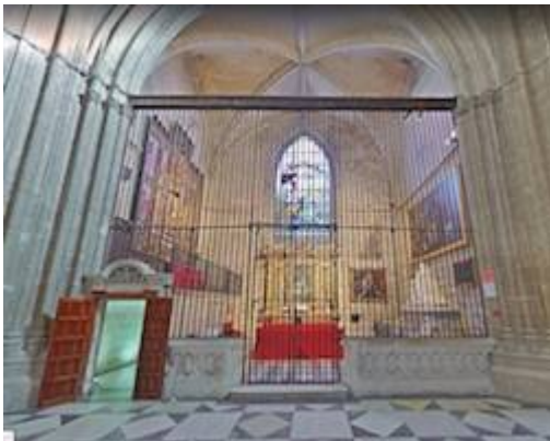
Capilla de San Bartolomé = Capilla de Santa Ana. Catedral