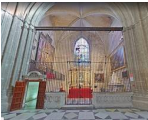
Capilla de San Bartolomé = Capilla de Santa Ana. Catedral