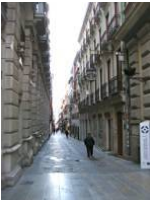
Calle Zacatín. Fotografía de Juan Ruiz Jiménez