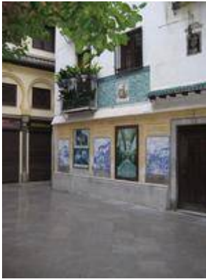
Pequeña plaza en el interior de la Alcaicería.