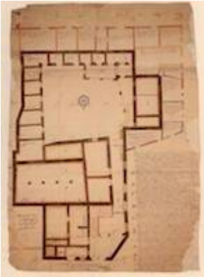
Planta de la cárcel pública de Sevilla. Madrid. Archivo Histórico Nacional