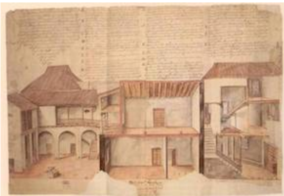
Demostración de la mitad sur de la cárcel pública de Sevilla. Madrid.