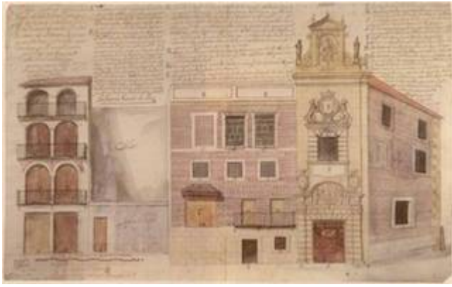
Diseño de la cárcel pública de Sevilla. Madrid. Archivo Histórico Nacional