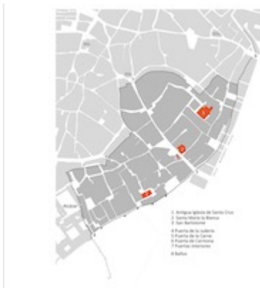
Plano de la judería de Sevilla. Oscar Gil Delgado. "Una sinagoga desvelada en Sevilla: estudio arquitectónico". Sefarad 73 (2013), p. 71