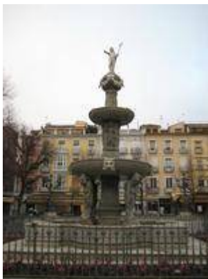
Fuente del antiguo convento de San Agustín (actualmente en la plaza de Bibarrambra).