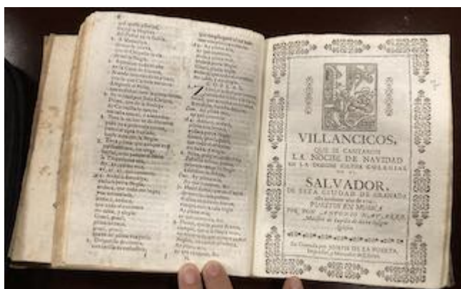
Letras de los villancicos de Navidad de la colegiata del Salvador (1741)