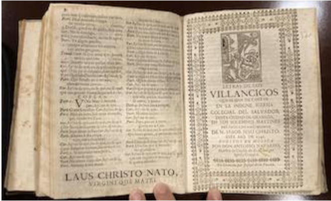
Letras de los villancicos de Navidad de la colegiata del Salvador (1746)