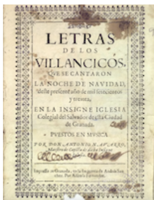
Letras de los villancicos de Navidad de la colegiata del Salvador (1723)