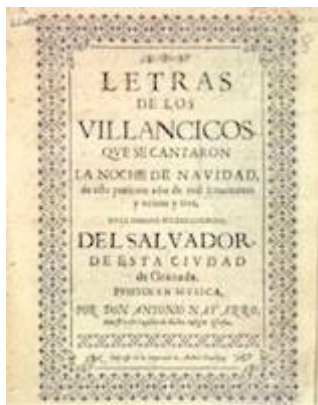
Letras de los villancicos de Navidad de la colegiata del Salvador (1723)