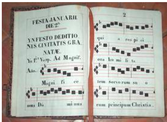
Oficio de la Toma de Granada. Hernando de Talavera (c.1492). Libro de Coro LXIX, fols. 1v-2r. Colegiata del Sacromonte