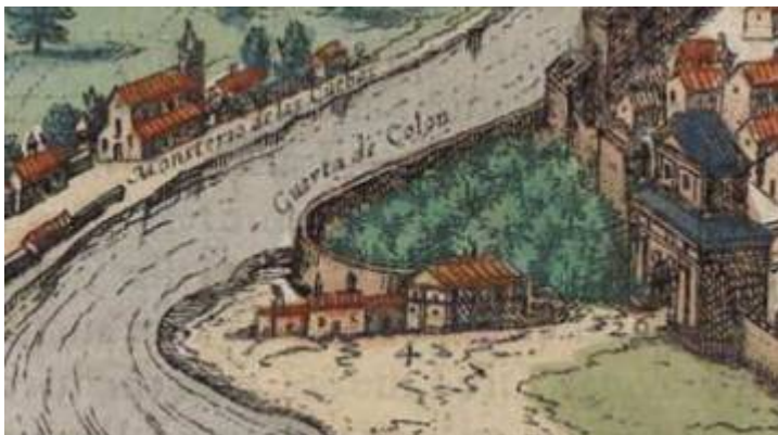
"Vista de Sevilla". Urbium praecipuarum Totius Mundi. Liber quartus . Colonia, Georg Braun y Frans Hogenberg, 1588