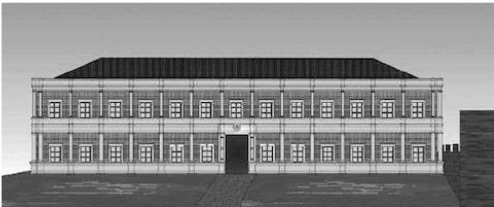
Restitución de la fachada principal del palacio de Hernando Colón