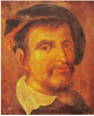
Retrato de Hernando Colón. Anónimo sevillano (s. XVII). Institución Colombina