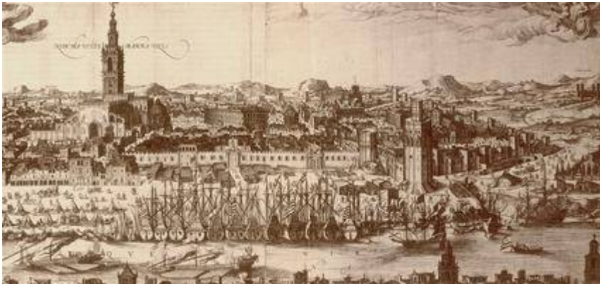
Vista del río Guadalquivir y del Arenal desde Triana. Johannes Janssonius (1617)