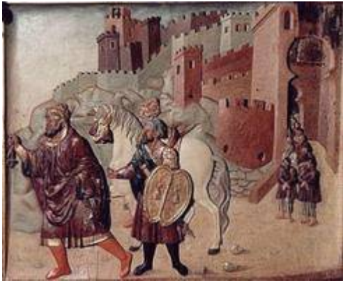
Boabdil entregando las llaves de la ciudad. Predela del retablo de la capilla real de Granada. Felipe Vigarny (1520-1522)