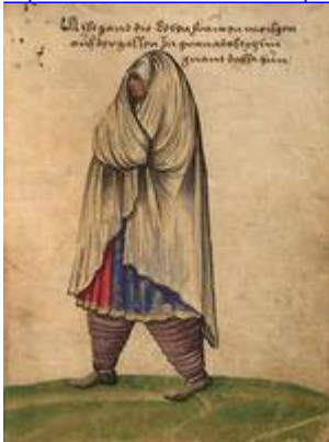
Traje de calle de morisca en Granada (c. 1529). Trachtenbuch . Christoph Weiditz. Germanisches Nationalmuseum Nürnberg, Hs. 22474

https://www.historicalsoundscapes.com/recursos/1/5/07muaxaha-jadaka-algaith-tiempo-de-amores-en-al-andalus--ibn-alkhatib-.mp3