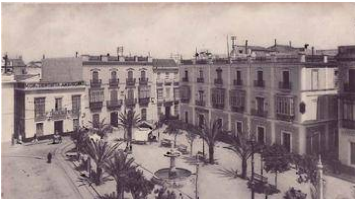
Plaza de la Magdalena (antigua plaza del Pacífico)