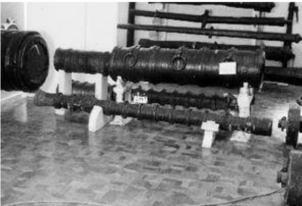
Caña de bombardeta (finales del siglo XV)