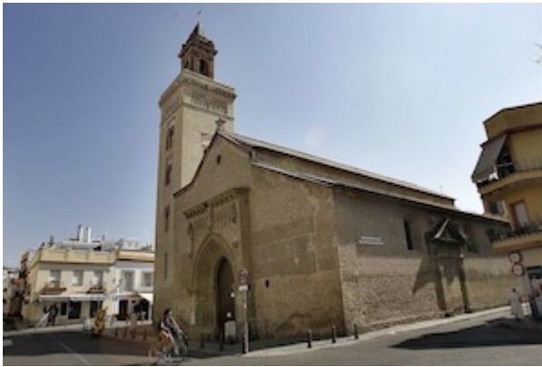
Iglesia de San Marcos