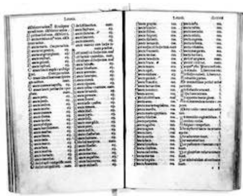
Letanía. [ Breviarium secundum consuetudinem ecclesiae Hispalensis . Sevilla: Estanislao Polono y/o Jacobo Cromberger, c. 1500–1505], fols. clxxxviiv-clxxxviii