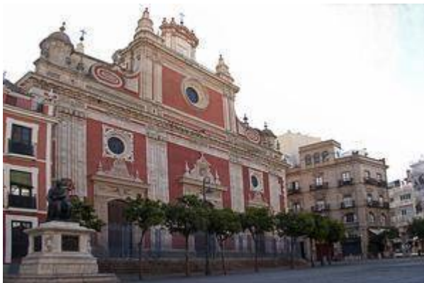
Plaza del Salvador.