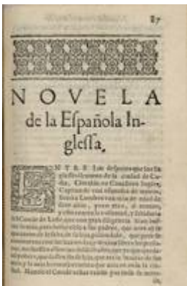
La española inglesa en Novelas ejemplares . Miguel de Cervantes (Madrid, Juan de la Cuesta, 1613)