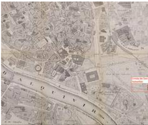
Localización de la ermita de San Sebastián (1868)

https://embed.spotify.com/?uri=https://open.spotify.com/track/7bFRIMalj1rg2s07GanQbF?si=kXAR_hRMRYuP_rahn7m9lg