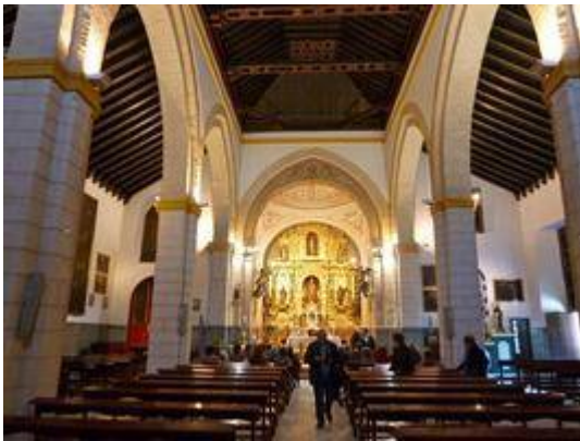
Ermita de San Sebastián