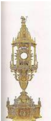
Custodia de la procesión del Corpus Christi (finales del siglo XV)