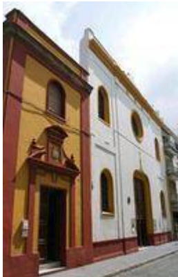
Colegio de San Gregorio o de los ingleses.