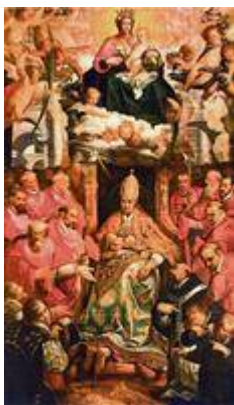
Triunfo de San Gregorio . Juan de Roelas (1608)