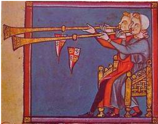
Trompeta (añafil). Cantiga 320. Códice de los Músicos, fol. 286r