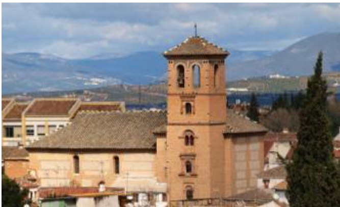
Iglesia de San Bartolomé