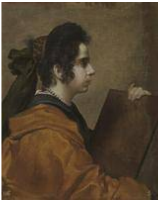
Sibila . Francisco Velázquez (c.1632)