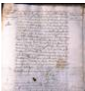
Partida de Casamiento de Diego Velázquez y Juana Pacheco (1618)