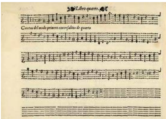
Modo primero con resabios de quarto. Juan Bermudo. Declaración de instrumentos musicales , (Osuna, Juan de León, 1555), fol. 114v