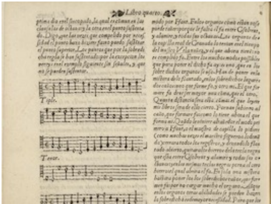
Juan Bermudo. Declaración de instrumentos musicales , (Osuna, Juan de León, 1555), fol. 89v