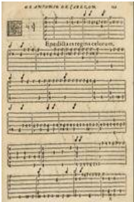
"Benedicta es coelorum con segunda y tercera parte parte, Jusquin". Antonio de Cabezón. Obras de música para tecla, arpa y vihuela (1578), fol. 159r.