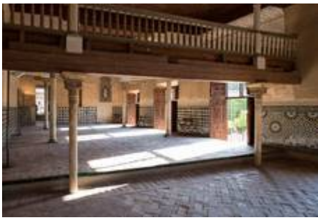
Mexuar y oratorio de la Alhambra