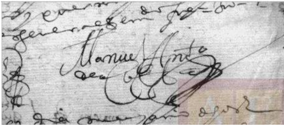
Rúbrica del ministril Manuel Antonio de Acosta