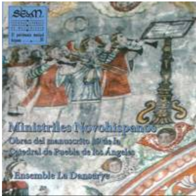
Canción, 5vv (ff. 98v-99r). Philippe Rogier. Ministriles Novohispanos. Obras del manuscrito 19 de la catedral de la Puebla de los Ángeles . Ensemble La Danserye. SEdeM, 2013.

https://www.historicalsoundscapes.com/recursos/2/5/4-cancion-rogier.mp3