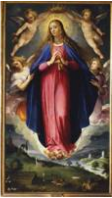
Inmaculada Concepción . Giuseppe Cesari. Museo de la Real Academia de Bellas Artes de San Fernando