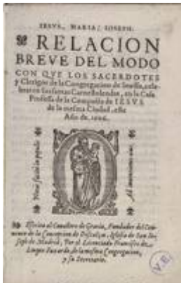
Relación breve del modo con que los sacerdotes y clérigos de la Congregación de Sevilla celebraron sus santas Carnestolendas en la casa profesa de la Compañía de Iesus de la mesma ciudad este año de 1606 . Francisco de Luque Faxardo