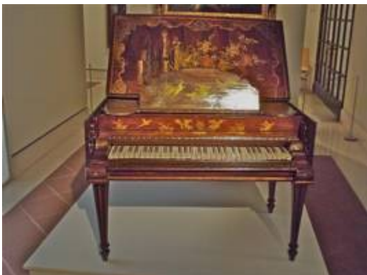
Piano. Francisco Pérez de Mirabal (atribuido) c. 1750. Fotografía de Elliot Brown