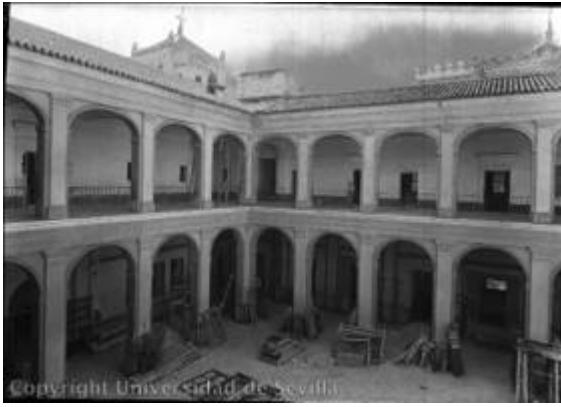
Patio del colegio de San Hermenegildo. Fotografía de Antonio Palau (1957)