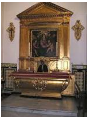
Sagrada familia con San Juanito (retablo de la Virgen de Belén). Pedro Villegas Marmolejo