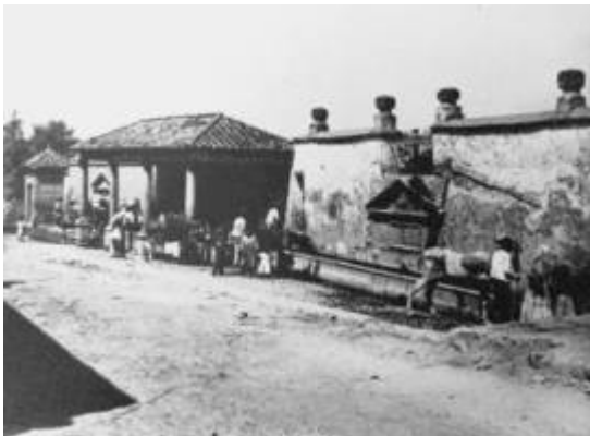
Pilar de la Fuente Nueva -2- (en la calle Camino de la Fuente Nueva)