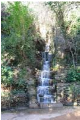
Sonidos del bosque de la Alhambra (1). Grabación de iesalbayzin