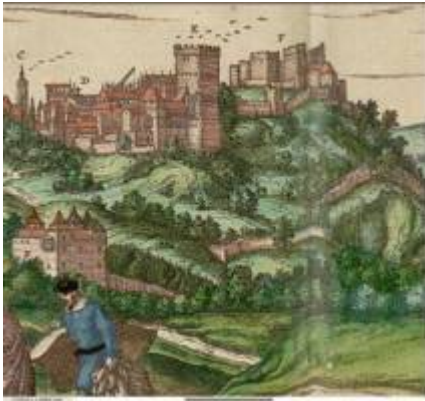
Bosque de la Alhambra. Joris Hoefnagel (1563)